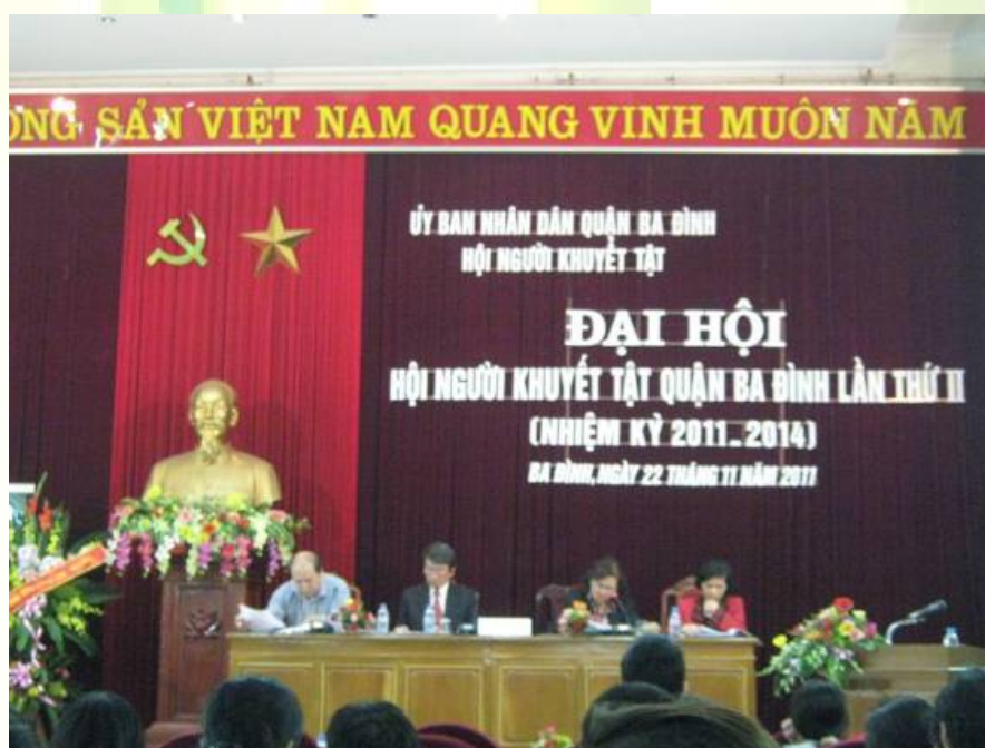
Đoàn Chủ tịch điều hành đại hội

Thông qua Dự thảo báo cáo kết quả hoạt động của hội NKT Ba Đình nhiệm kì I và phương hướng nhiệm kì II, Dự thảo báo cáo kiểm điểm công tác của Ban chấp hành hội, Tham luận về công tác xóa mù chữ và nâng cao nhận thức của NKT. Trung tâm Sống độc lập Hà Nội có Tham luận về công tác hỗ trợ NKT nặng. Đại hội đã chỉ ra những kết quả đáng khích lệ cũng như những tồn tại của Hội trong suốt chặng đường 3 năm đồng hành cùng NKT. Đại hội cũng thông qua danh sách 16 hội viên được đề cử vào Ban chấp hành Hội NKT quận Ba Đình khóa II, nhiệm kỳ 2011 – 2014.