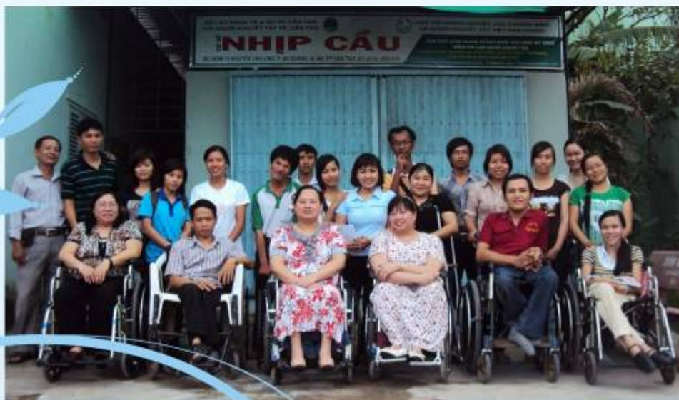
Tập huấn Sống độc lập và kỹ năng hỗ trợ NKT ở Cần Thơ