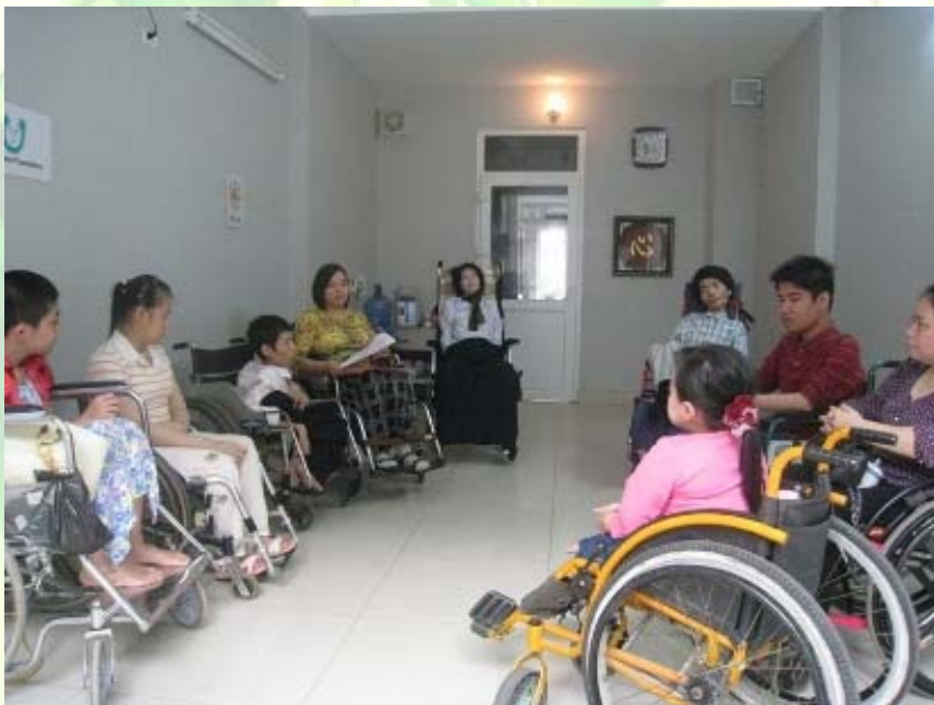
Các hội viên tham dự khoá TVĐC thứ 7 của TT.

thảo, các bạn đã quen với sinh hoạt TVĐC và trở nên tự tin hơn rất nhiều. Điều đặc biệt ở hội thảo này là các thành viên có độ tuổi chênh lệch khá nhiều và có trình độ học vấn khác nhau, nhưng không vì thế mà mọi người mất đi sự sôi nổi tham gia.