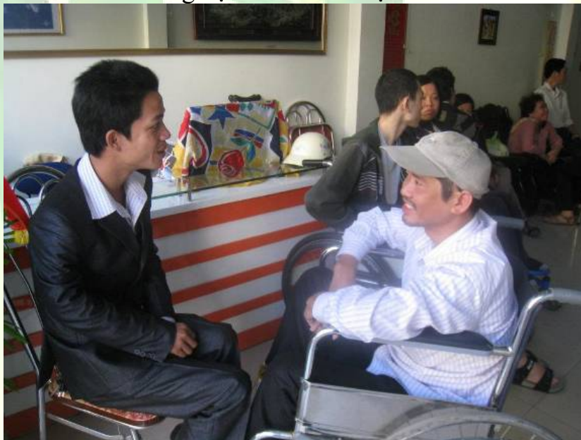
Thành viên mới trong buổi họp TVĐC

Qua các hoạt động của nhóm, người dân cũng đã có những cái nhìn và suy nghĩ tích cực hơn đối với NKT và những vấn đề liên quan cuộc sống của họ trong xã hội hiện nay. Cụ thể như có rất nhiều người dân đã giúp đỡ NKT, cũng như Nhóm sống độc lập Hải Phòng. Một số các cá nhân và tập thể đã bắt đầu ủng hộ nhóm cả về vật chất lẫn tinh thần.