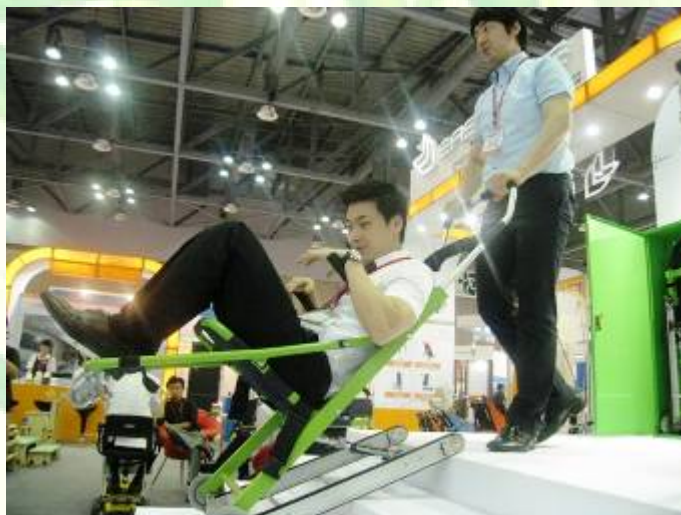
Xe lăn điện có thể giúp người khuyết tật đứng lên, hay xe lăn đưa người khuyết tật xuống các bậc thang trong các tòa nhà cao tầng trong các trường hợp khẩn cấp.

Tuy nhiên, không phải mọi nơi đều tiếp cận được. Có một số ga tàu điện ngầm xây cũ chưa được lắp thang máy, một số cửa hàng tiện lợi không được gắn thêm đường dốc để lên xuống, đôi khi có những khe lớn giữa toa tàu điện và sân ga gây khó khăn cho người khuyết tật lên xuống. Các cung điện và công trình cổ tuy được lắp thêm đường dốc ở cửa lớn ra vào, nhưng người khuyết tật vẫn không thể đi vào tất cả các công trình bên trong do có quá nhiều bậc lên xuống. Những điều đó cho thấy những người khuyết tật Hàn Quốc vẫn còn cả một chặng đường dài để hoàn thiện môi trường và xây dựng một xã hội hoàn toàn hòa nhập.