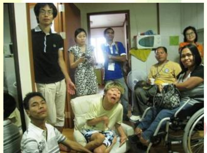
Đến thăm TT SDL Seoul và gặp gỡ người khuyết tật nặng HQ đang sống độc lập