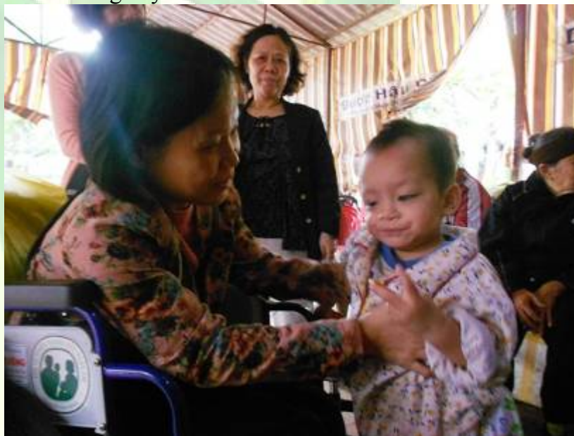
Em bé ấm áp trong vòng tay yêu thương

khách đến thăm ôm ấp vỗ về. Người bón cho cái bánh, người bón cho múi cam, người bón cho thìa sữa. Ai cũng muốn tranh thủ dành tình yêu thương cho các em bé thiệt thòi. Tôi cũng đón lấy một em vào lòng để âu yếm, vỗ về. Mới đầu em còn rụt rè, e ngại nhưng tôi vẫn ân cần bế ẵm em trong lòng, nắn chân nắn tay truyền hơi ấm cho em, dần dần em hết lạ nhớn miệng cười nói ê a. Đến lúc chúng tôi bắt đầu gần gũi và quyến luyến nhau thì đến giờ nhà chùa mời ăn bữa cơm chay và tôi phải tạm chia tay em. Tôi đã bắt đầu cảm nhận thấy trong lòng mình nhen lên một nỗi buồn và xót xa khó diễn tả. Thương các em nhỏ không được sống trong vòng tay yêu thương của cha mẹ. Thương các cụ già đến tuổi xế chiều mà không được vui vầy cùng con cháu. Cũng an ủi là những mảnh đời thiếu may mắn ấy còn có cơ hội gặp nhau và chia sẻ nỗi buồn của mình tại ngôi chùa Bồ Đề nhỏ bé mà ấm áp tình thương này.