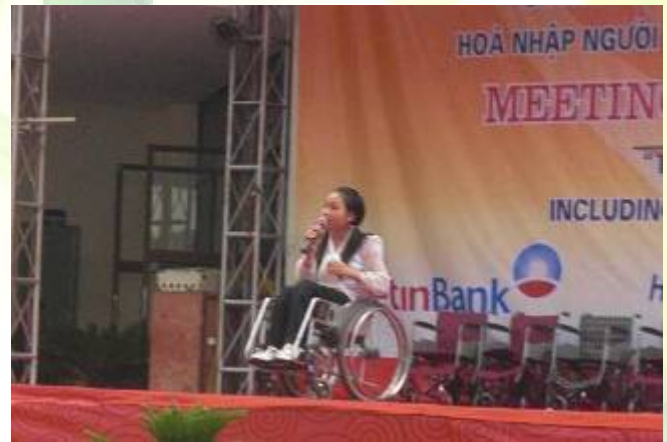
Trung tâm Sống độc lập trong ngày 3 tháng 12.