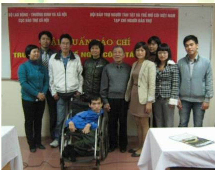
Thành viên BBT Bản tin TTSDL HN tham gia khoá tập huấn “Tập huấn báo chí – truyền thông về nghề công tác xã hội” tại Trường cán bộ Phụ nữ trung ương.

Công tác xã hội (CTXH) ở Việt Nam được hình thành trên cơ sở tình cảm tốt đẹp giữa con người và con người. Ngành công tác xã hội ở nước ta được phát triển từ cuối thập kỷ 40 nhưng đã bị lắng xuống do những biến động lịch sử và đã nhen nhóm trở lại vào năm 90 của thế kỷ trước. Trải qua các giai đoạn, tinh thần nhân đạo và lòng yêu thương đồng loại luôn luôn gắn liền với quá trình hình thành và phát triển của các chính sách, luật lệ xã hội của từng thời kỳ khác nhau. Những tác động của toàn cầu hóa công nghiệp hóa, kinh tế thị trường đã làm tăng nhu cầu của con người về vật chất cũng như tinh thần, mặt khác với sự phát triển đó chắc chắn sẽ để lại những hệ quả đối với cộng đồng, các gia đình và cá nhân. Những yêu cầu về hiện đại hóa đang ngày một lớn hơn, các hình thái sống thay đổi nhanh chóng tạo nên áp lực đối với các gia đình và cộng đồng phải nỗ lực giải quyết các vấn đề và chăm sóc những đối tượng không có khả năng tự chăm sóc cho chính mình. Vì thế, công tác xã hội xem việc vận dụng các tài nguyên cộng đồng để giúp con người là rất quan trọng. Mặt khác, CTXH có vai trò trong bảo đảm quyền con người, nhân phẩm, giá trị con người, công bằng và bình đẳng xã hội, thúc đẩy và xây dựng một xã hội hài hòa vì hạnh phúc của các cá nhân trong xã hội.