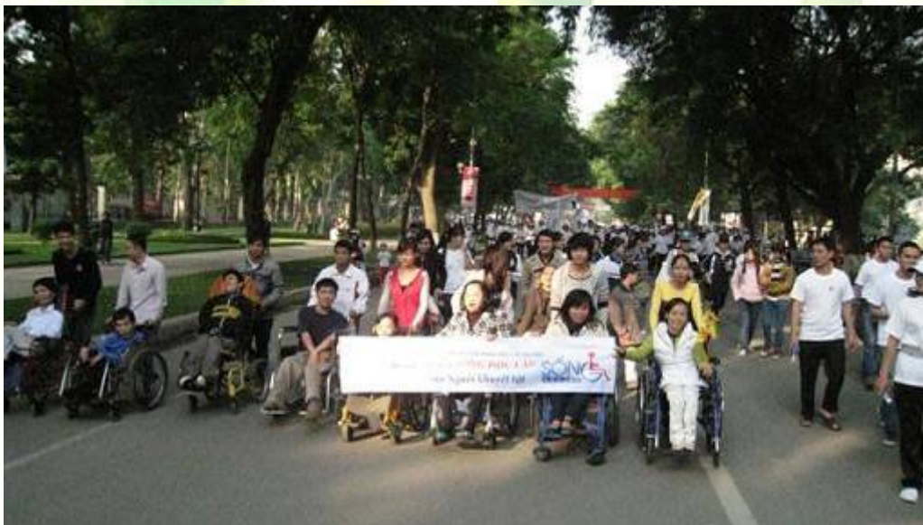
Các hội viên TT Sống độc lập tại Cuộc chạy Vì trẻ em năm 2011.

Đây là lần thứ 2, các hội viên của Trung tâm Sống độc lập Hà Nội tham gia cuộc chạy này. Sự hiện diện của các hội viên Trung tâm là hình ảnh đẹp về tâm lòng của NKT đối với trẻ em mắc bệnh hiểm nghèo, góp phần nâng cao nhận thức cộng đồng về NKT thông qua việc tham gia các hoạt động xã hội.