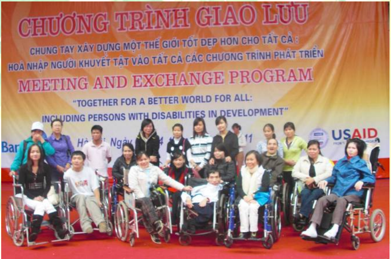
CÁC HỘI VIÊN TRUNG TÂM SỐNG ĐỘC LẬP HÀ NỘI TRONG NGÀY 3 THÁNG 12 NĂM 2011