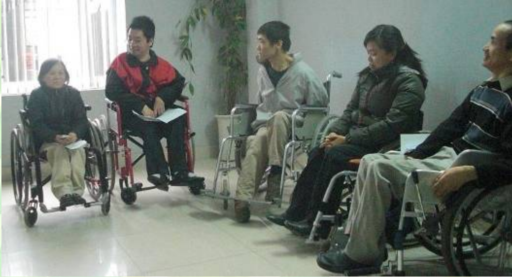
Buổi tham vấn cuốn hút người tham dự.

sức mạnh tập thể, là động lực để tập thể đó phát triển. Những khái niệm mới đó đã giúp cho những hội viên tham gia TVĐC một cách hào hứng hơn.